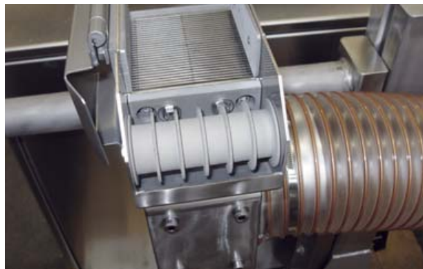
Strangabsaugung SE 100-2