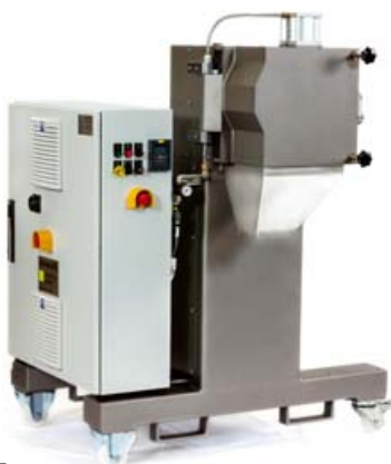
Primo 100 E