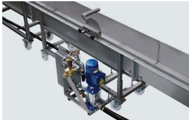
Kühlwanne KW 160 mit integriertem Prozesswasseraggregat