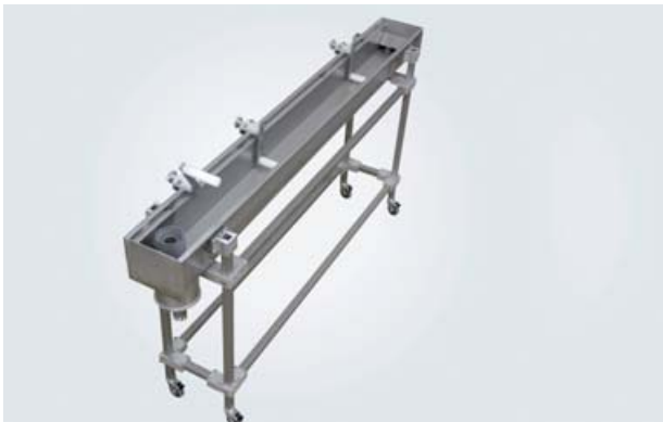
Kühlwanne KW 160