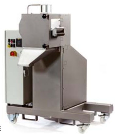
Primo 200 E