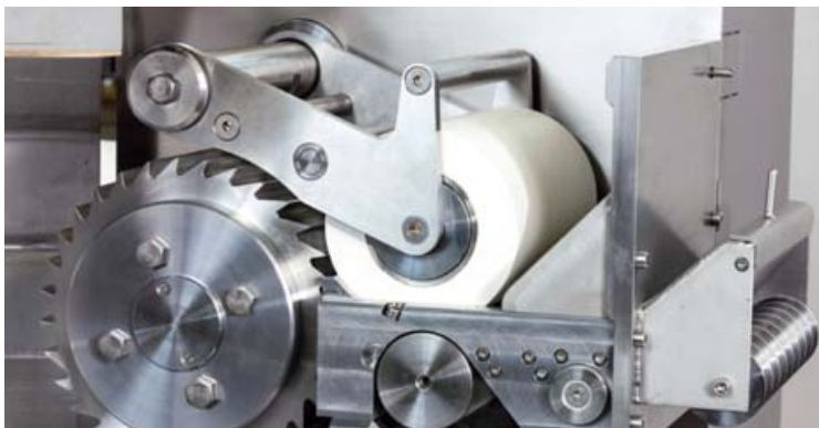
PRIMO 200 E mit Elastomer-Einzugswalze