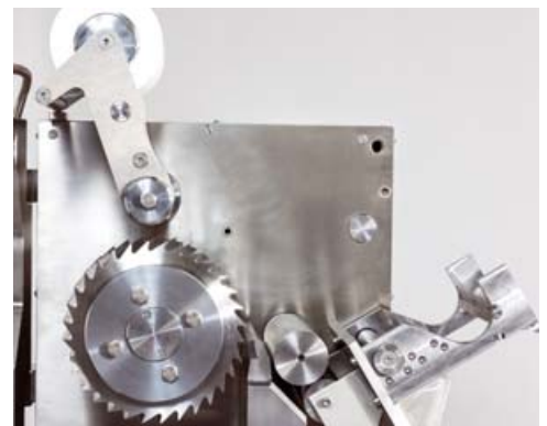
Primo 200 E Schneidkammer